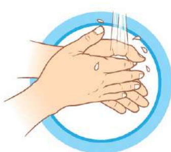
ЧАСТО МОЙТЕ РУКИ С МЫЛОМ